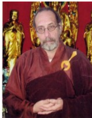
Fa Dao Shakya